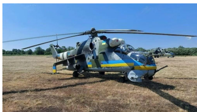
Původně český vrtulník Mil Mi-24, nyní darovaný Ukrajině v ukrajinských barvách pro identifikaci